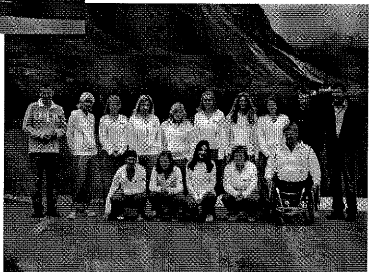
Damen 1. Klasse 2009 Meister und damit Aufstieg in die Land B