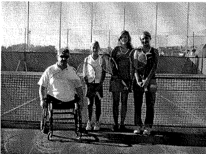
U14 Mädchen: Steirischer Vizemeister 2009

Alle Mannschaften bitten bei den Heimspielterminen um eure Unterstützung: